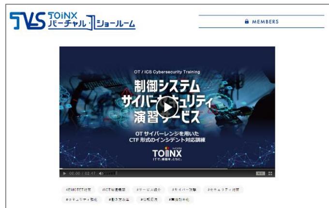
動画コンテンツイメージ

当社の取り組みを視覚的に分かり易くお伝えするため、動画コンテンツを拡充いたしました。コーポレートサイトにおいては、当社の強み、保有技術、業務内容などを社員の生の声でご紹介するインタビュー動画を公開しております。また、サービス情報サイトにおいては、「バーチャルショールーム」のコーナーを設け、各サービスをご紹介する動画に加え、お客さまの IT スキル向上、DX 人材育成につながるセミナー動画などを公開しております。